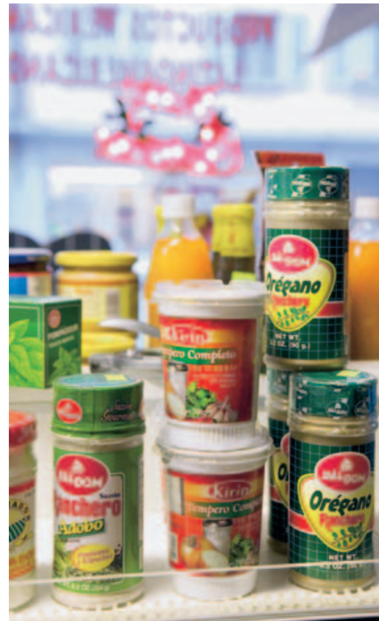
GUT GEWÜRZT: Die landestypischen Gewürze sind der Schlüssel zu jeder fremden Küche.