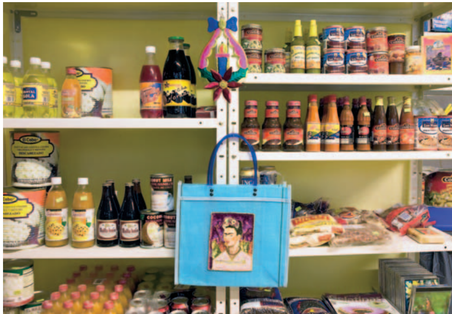
BESSER ALS JEDER SUPERMARKT: Nicht alle fremdländischen Produkte sind billig. Aber Beratung und Rezeptvorschläge der Spezialisten sind gratis.

Fremde sind Freunde, die man noch nicht kennen gelernt hat. Besonders in der Luzerner Baselstrasse. Hier hofften Bürgerrechtslose aufs Luzerner Stadtbürgerrecht. Hier fanden italienische Gastarbeiter eine bescheidene Bleibe. Hier treffen sich heute Menschen aus der halben Welt – ausser Schweizer.