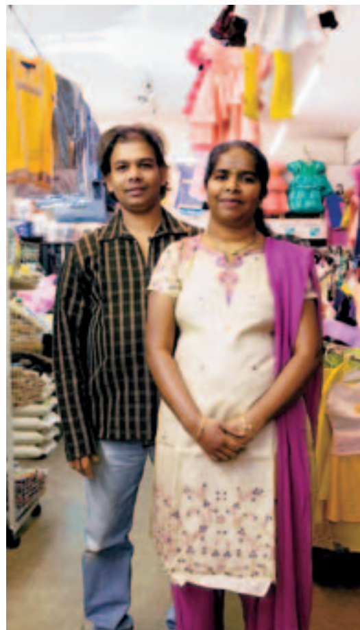
SRI LANKA: Bei der Familie Thomas gibts nicht nur Sachen zum Essen.

Vorbereitungszeit: 45 Minuten Kochzeit: 60 Minuten Schwierigkeitsgrad: einfach