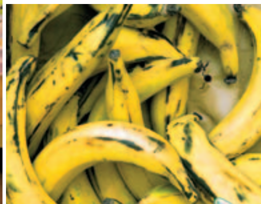
GEMÜSEBANANEN: Obwohl oft Kochbananen genannt, schmecken sie roh gut.