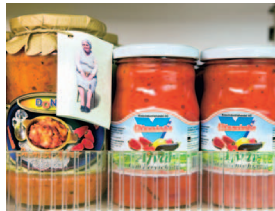
WIE IN GROSSMUTTERS VORRATSSCHRANK: Eingemachtes verkürzt das Kochen.