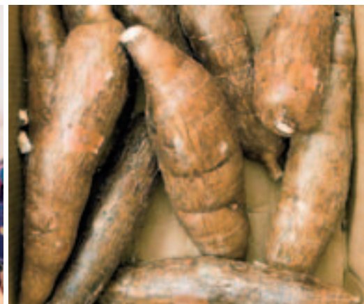
MANIOKWURZELN: Sie sind sehr nährstoffreich, ob gemahlen oder geröstet.

Was Mais für Mexiko, das ist Reis für Sri Lanka. 10000 Reissorten soll es weltweit geben, einige davon findet man zu günstigen Preisen in den asiatischen Geschäften an der Baselstrasse. Man riecht, dass Curry mehr als ein gelbes Pulver ist. Und im «Thomas Shop» sieht man, dass bei den Tamilen die Liebe nicht nur durch den Magen geht. An den Wänden indische Musikvideos, in Glasvitriolen Goldschmuck aus Singapur, unter der Decke farbenfrohe Saris und Kinderkleider. Nicht nur wegen seiner Frau und der beiden Kinder. Geht man der Nase nach, findet man allerlei Köstlichkeiten aus Sri Lanka und Indien: gefrorene Krabben und frische Fische, Mango und Schlangenbohnen, Chutneys und Gewürzpasten, gelbe, rote und schwarze Linsen, verdauungsfördernde Paan-Blätter. In Sri Lanka ist das Essen auch Medizin.